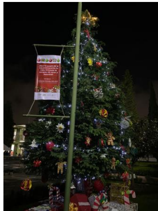
(2023), El árbol de navidad , archivo del plantel. [fotografía con derecho propio].

En su intervención, el cronista y el director del plantel coincidieron en que el encendido del árbol representaba el reencuentro de toda la comunidad, de ser mejores cada día, esperando la luz de la bondad, la luz de la alegría y la luz de la felicidad.