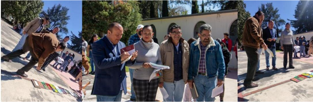
Aguilera, B.E. (2023), Inauguración del Kilómetro del Libro , [fotografía con derecho propio].

Continuando con las Jornadas, por la tarde del mismo 24 de noviembre, en punto de las cuatro de la tarde, se realizó un sentido homenaje a los administrativos y docentes por su sobresaliente trayectoria de más de veinte años de labores ininterrumpidas y su compromiso con el plantel, contribuyendo con sus labores a la grandeza de la institución, reza el Reconocimiento. Sin duda, fue una actividad de gran importancia para el plantel y que fue recibida con mucho agrado por la comunidad.