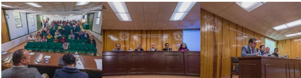
269 Sesión Ordinaria del Colegio de Cronistas en el Plantel "Nezahualcóyotl".

En este sentido, el M. en Ed. Erick Vieyra Méndez, Director del plantel "Nezahualcóyotl", a nombre de la administración hizo este sencillo pero justo