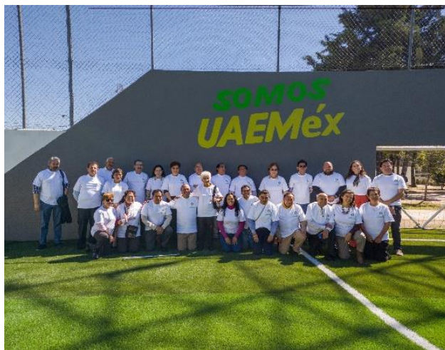
Pérez, V.D (2023), Foto del recuerdo de la 269 Sesión Ordinaria del Colegio de Cronistas en el Plantel "Nezahualcóyotl". [fotografía con derecho propio].

Al finalizar se tomó la foto del recuerdo con la playera conmemorativa que donó la administración del plantel. Posteriormente se continuó con la sesión.