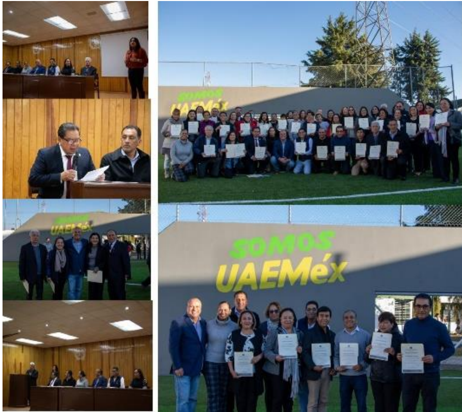
Aguilera, B.E. (2023), Homenaje al personal administrativo y docente con veinte años o más dentro del plantel "Nezahualcóyotl" [fotografía con derecho propio].

Para concluir la actividad se tomó la fotografía del recuerdo y todos los asistentes expresaron su emoción, contentos y en camaradería, y por un momento el tiempo se detuvo entre abrazos de los homenajeados y las autoridades.