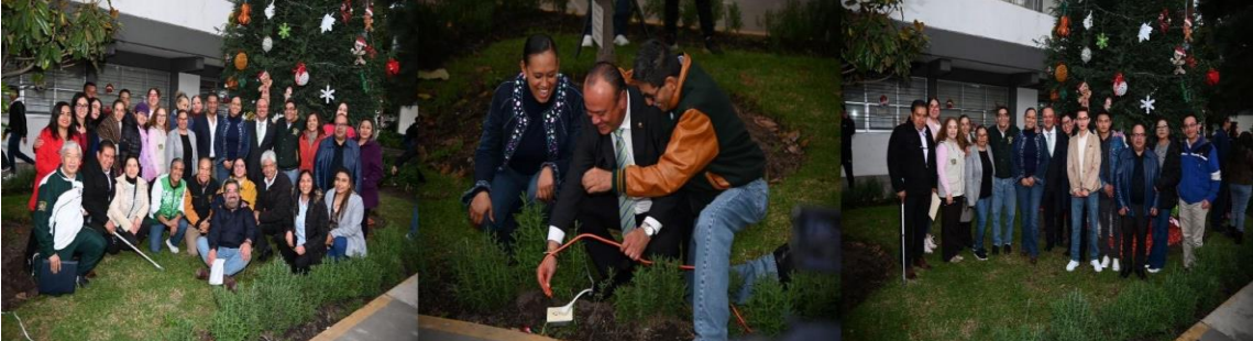
(2023), Encendido del árbol de navidad , archivo del plantel. [fotografía con derecho propio].

El encendido del árbol de navidad tuvo lugar el 30 de noviembre a las 17:20 hrs., a propuesta de la Academia de Arte y los alumnos de quinto semestre de ambos turnos, quienes ambientaron el espectáculo con una kermess.