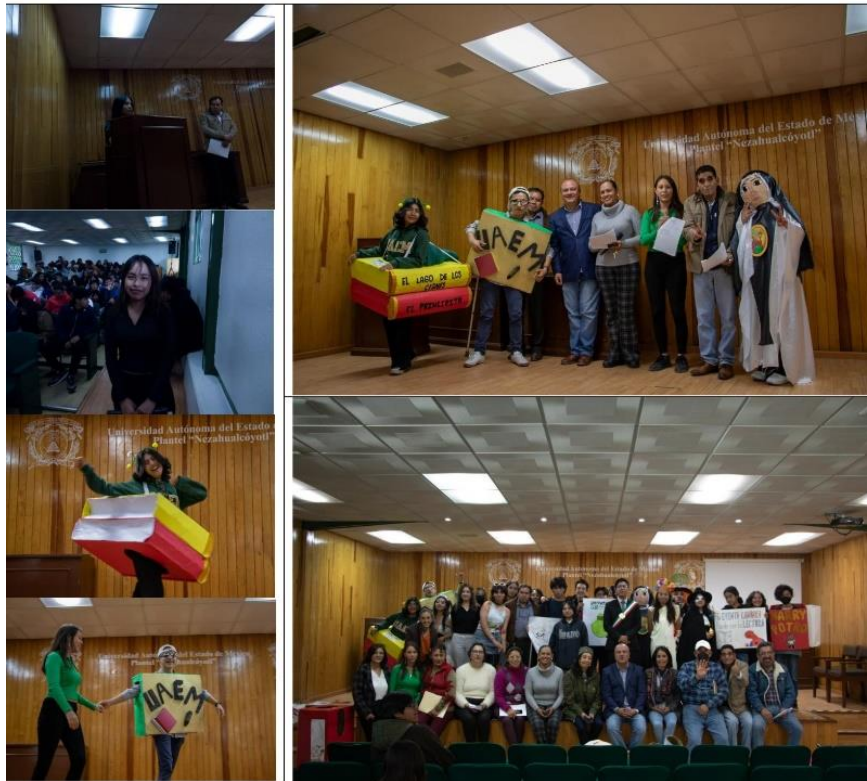
Aguilera, B.E. (2023), Concursos de creación propia, carteles, botargas. [fotografía con derecho propio].