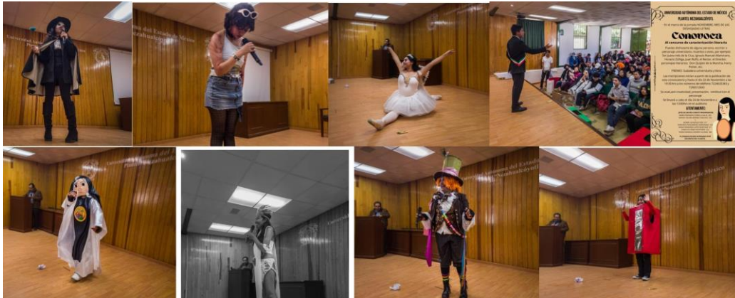
Pérez, V.D (2023), Concursos de Caracterización y Botargas , [fotografía con derecho propio].