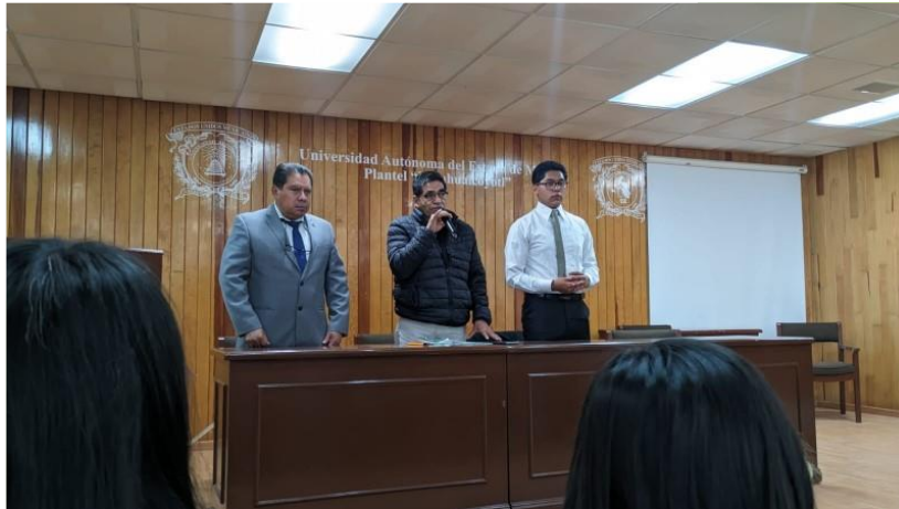
Pérez, V.D.(2023), Inauguración de Noviembre, mes de las deshojadas letras , [fotografía con derecho propio].

Después de la inauguración, en todo el plantel se dio una efervescencia de actividades, dando énfasis especial a los círculos de lectura y conferencias relacionadas con la identidad universitaria y temáticas literarias.