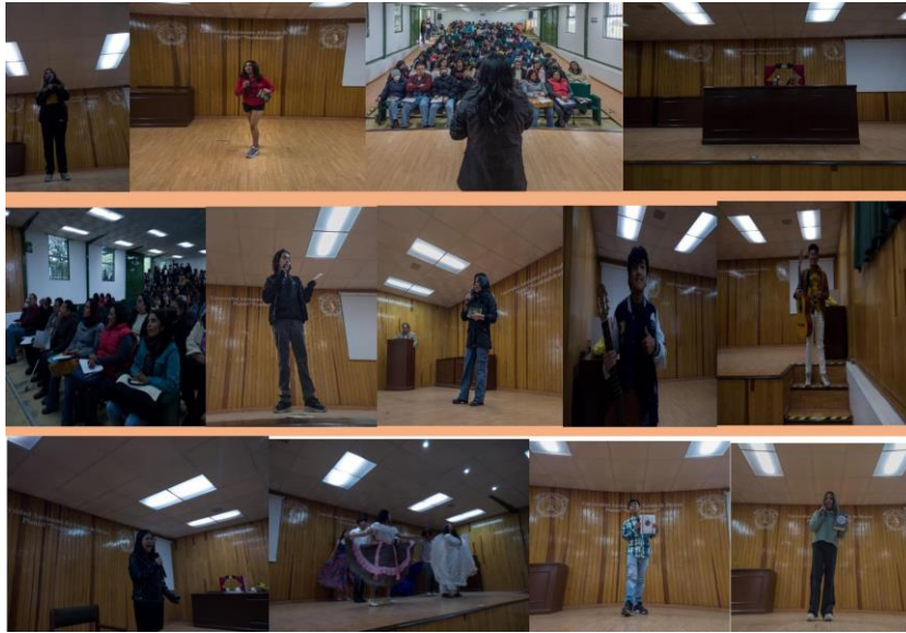
Pérez, V.D (2023), Concursos Platícame un libro, música, baile, teatro. [fotografía con derecho propio].

alusivas a personajes o autores literarios, caracterización referente a personajes identitarios y carteles de promoción a la lectura.